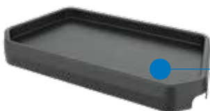
Tablett mit Antirutschmatte